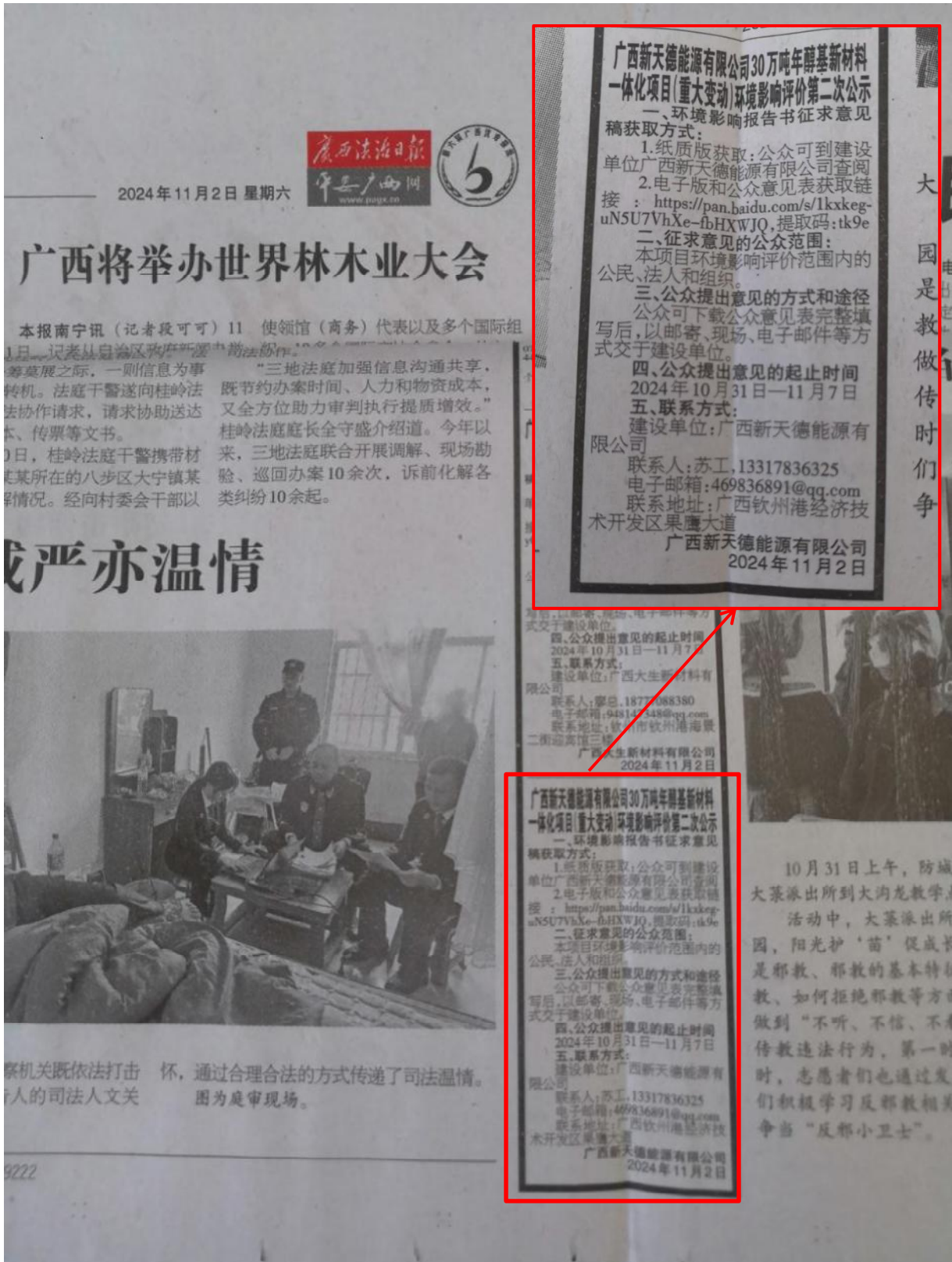
图 3-2 环境影响评价公众参与报纸公示（2024.11.2）