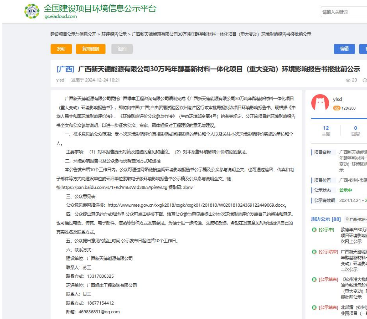
图 6-1 报批前公示截图

项目建设单位在全国建设项目环境信息公示平台发布项目环境影响评价公众参与说明及环境影响报告书公示，载体选取符合《环境影响评价公众参与办法》的要求。公示网址： https://www.eiacloud.com/gs/detail/1?id=41224bELz2 ，见图 6-1。