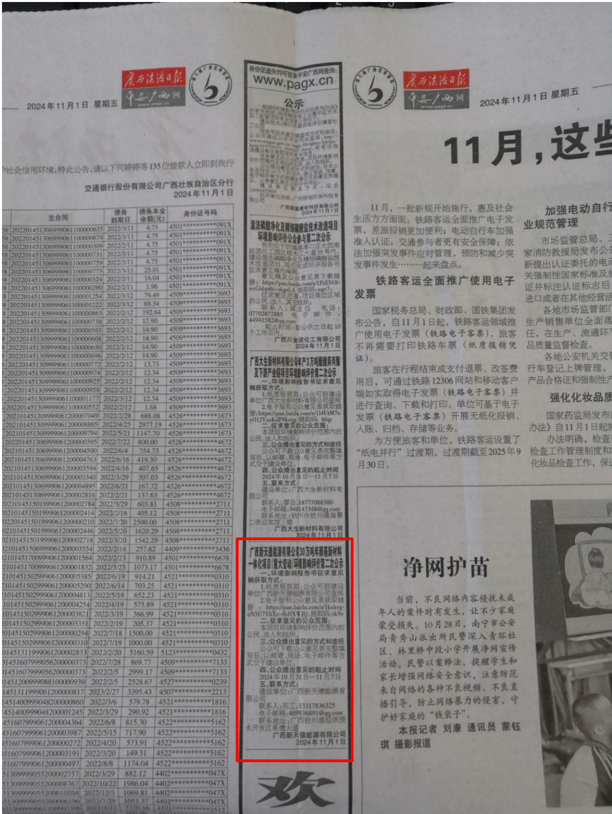
图 3-2 环境影响评价公众参与报纸公示 (2024.11.1)