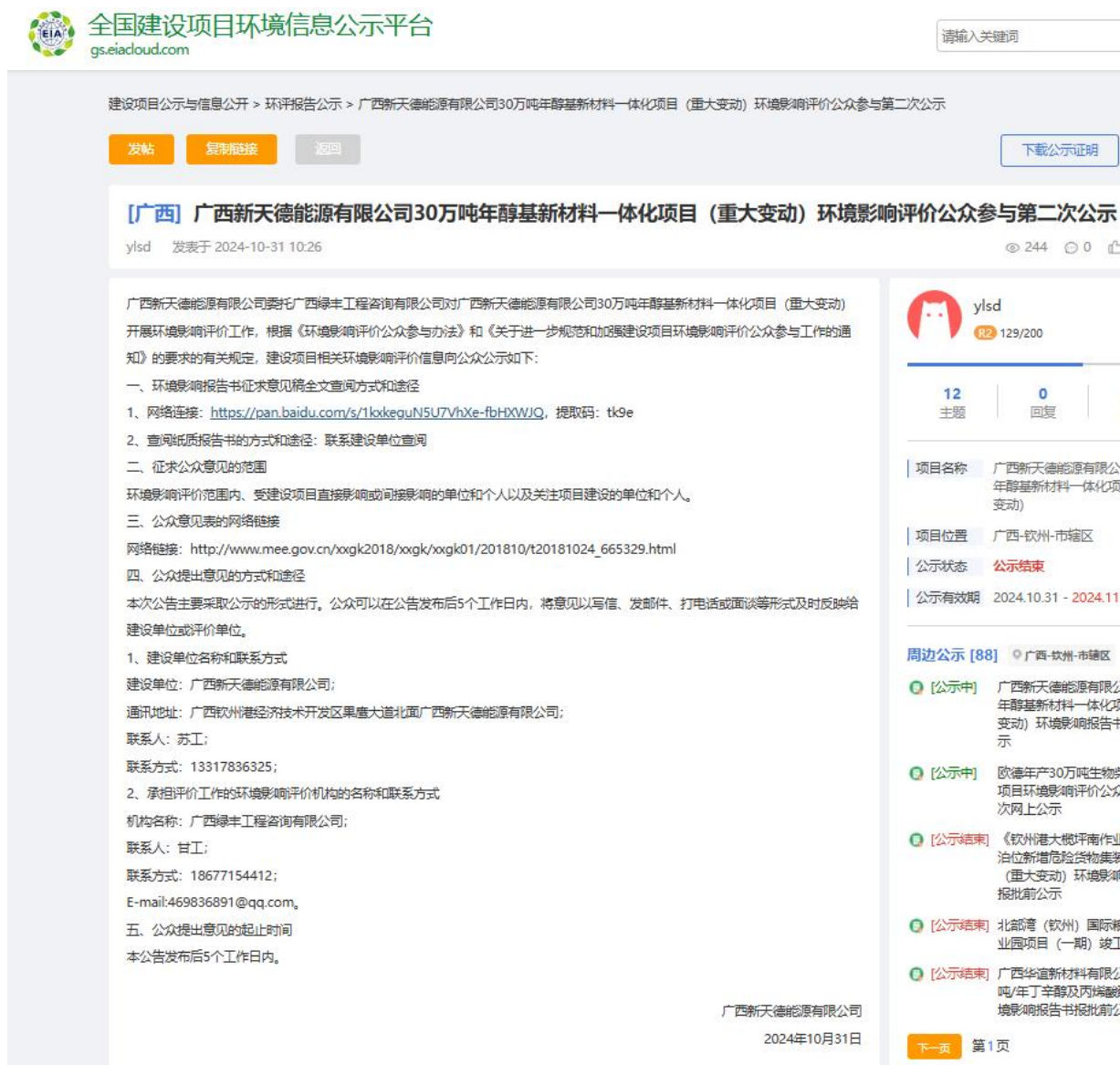
图 3-1 征求意见稿网上公示截图