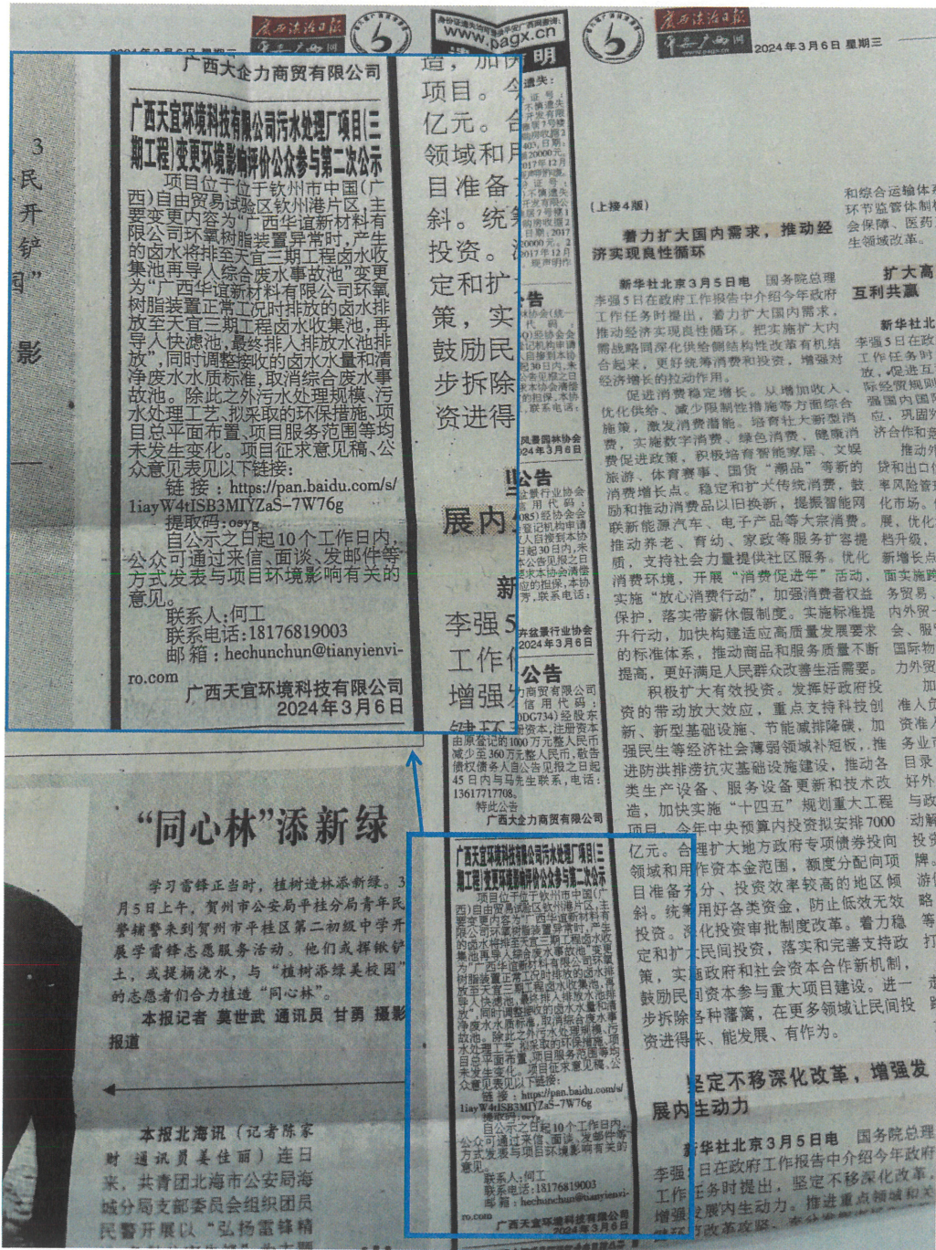
图3-2 征求意见稿纸媒公示情况照片