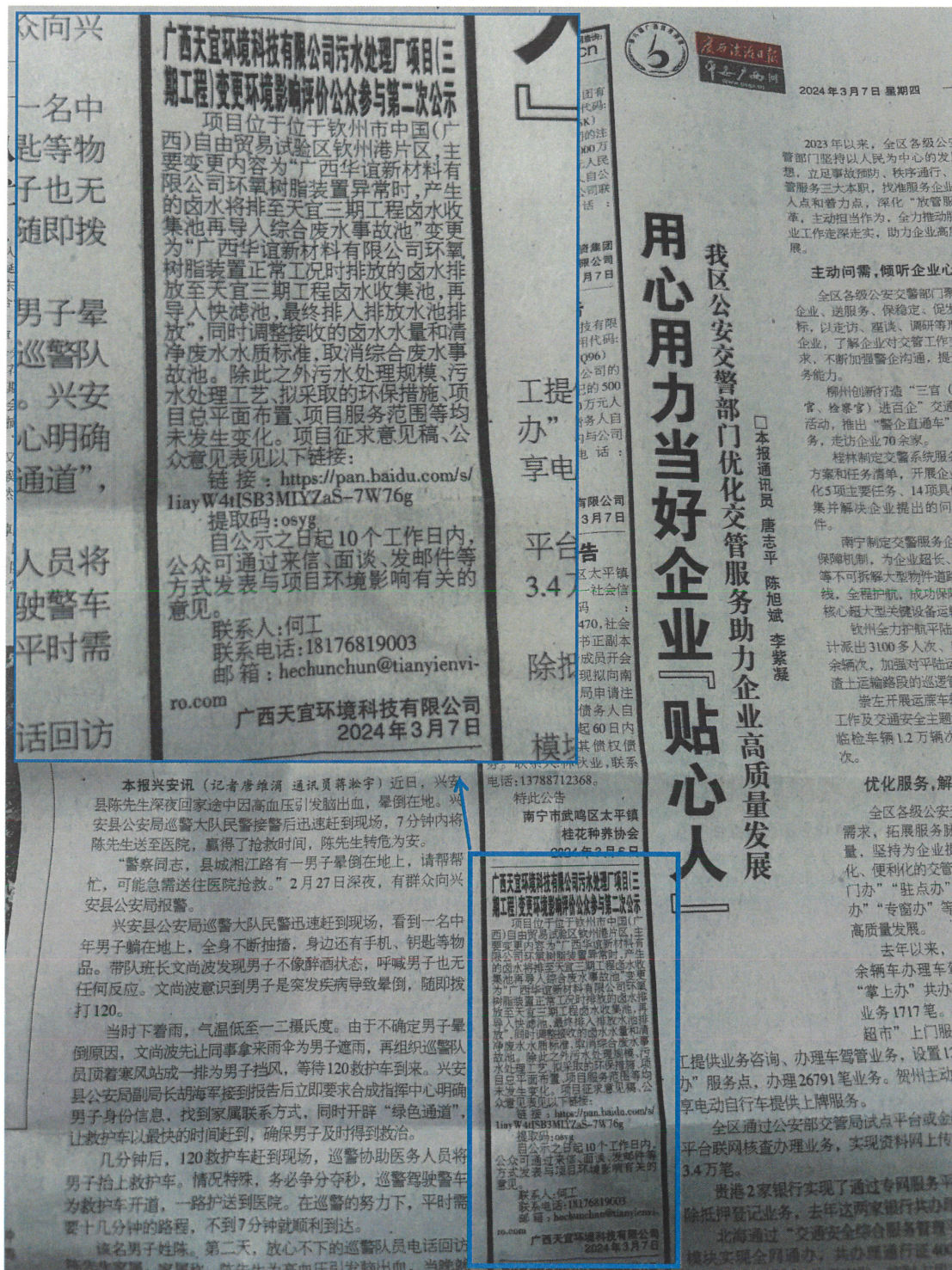
图3-3 征求意见稿纸媒公示情况照片