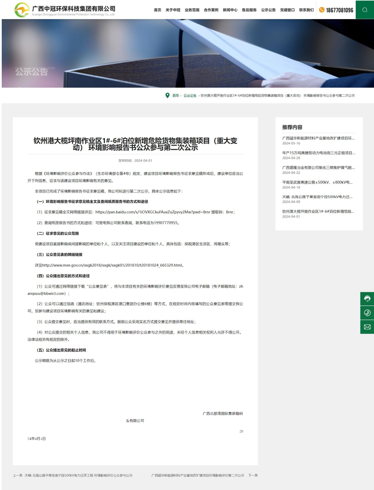
附图 2 项目公众参与第二次网络公示截图