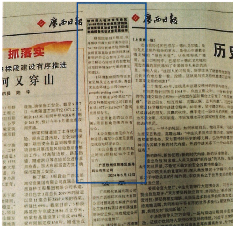
图 3 项目征求意见稿在第 26598 期《广西日报》第一次公示