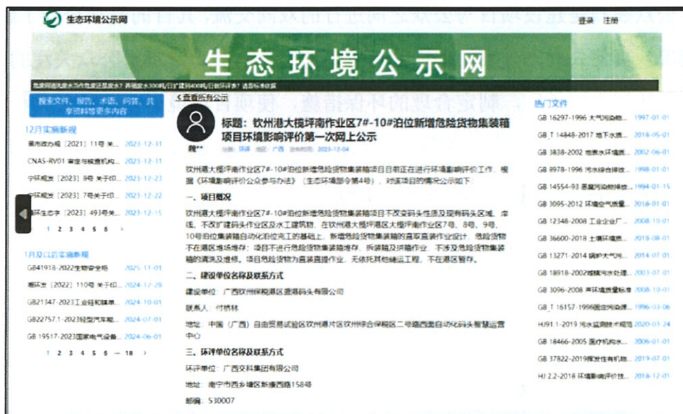
图 1 生态环境公示网第一次公示

2024 年 4 月 29 日，项目建设单位在生态环境公示网( 环保小智 (qsyhbgi.com) )进行首次环境影响评价信息公开，截图见图 1。