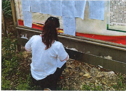
图 5 项目张贴公示照片

建设单位于 2024 年 5 月，建设单位在周边敏感点公告栏粘贴项目环境影响报告书征求意见稿公告公示。