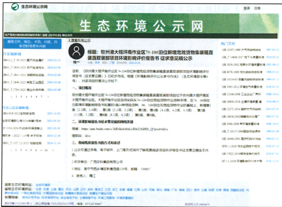
图 2 环境影响报告书征求意见稿网站公示

2024 年 5 月 9 日，项目建设单位在生态环境公示网(环保小智 (qsyhbgi.com))，截图见图 2。