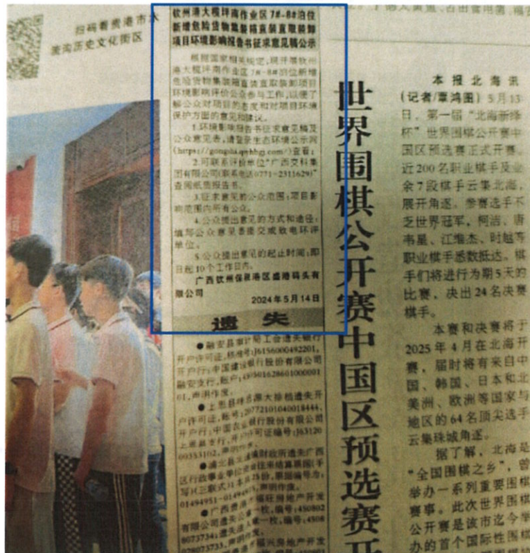
图 4 项目征求意见稿在第 26599 期《广西日报》第二次公示